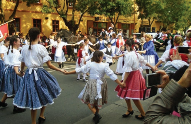
Táncra perdült az utca népe: körtánc a főtéren