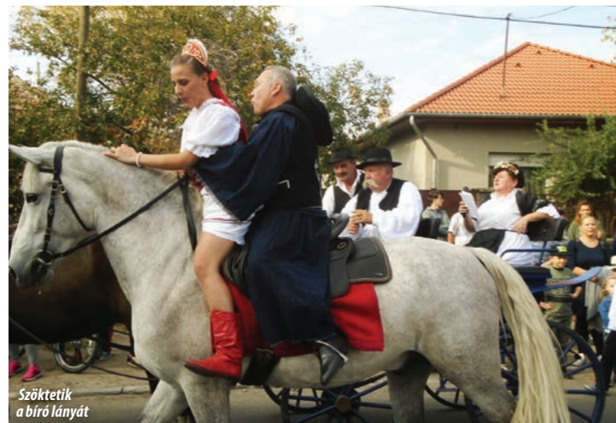
Szóktetik a bíró lányát

Október 7-én minden körülmény adott volt ahhoz, hogy kedve legyen a résztvevőknek a fel szabadult jókedvhez. A jó termés után remek minőségű bor várható, és ragyogó napsütés csalogatta a nagyon sok érdeklődőt a szívesen várt ünnepi eseményen való részvételre. Egyre többen érkeznek már más helységekből is, messzire eljut a rendezvény jó híre. Pedig most – az október 6-i gyásznapi miatt – a megszokott szombat helyett vasárnapra csúszott át ez a rendezvény, és a felvonulók közül ezúttal hiányzott a Lions Club és a Monori Strázsák Néptáncgyűjtés is. A Gazdakör és a Borrend azonban kitétt magáért, és többek között a vasadi és a