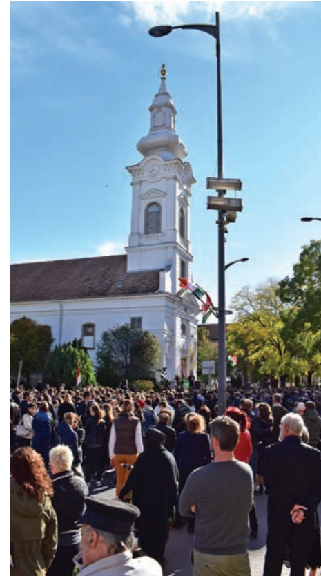
Ünnepi megemlékezés a Szent István téren

„1956-ban megvillant valami a két világháború közti hazánkból, sőt, még talán a reformkori Magyarországból is. A szabad, független és saját lábán megállni kívánó és a maga erejéből gyarapodó Magyarországból. A nagyhatalmak játékszerétől független szerepben létezni tudó, erősödő, öntudatos, a maga útját járó magyar polgári világból” – mondta el a városvezető. „Hol tarthatna ma ez az ország, ha nem olyanok szabadítják fel, akik megitták a kölnivizet? És hol tarthatna ez az ország, ha tisztességes, valódi rendszerváltás történt volna 1990-ben?”