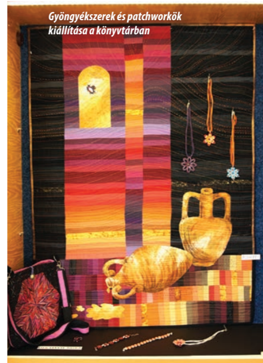
Gyöngyészerek és patchworkök kiállítása a könyvtárban