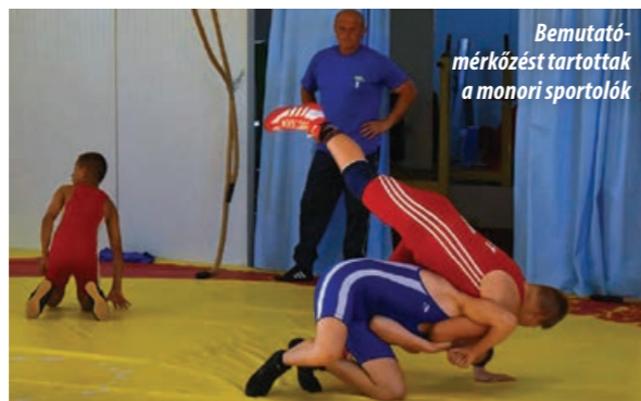
Bemutató-mérkőzést tartottak a monori sportolók