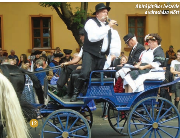
A bíró játékos beszéde a városháza előtt