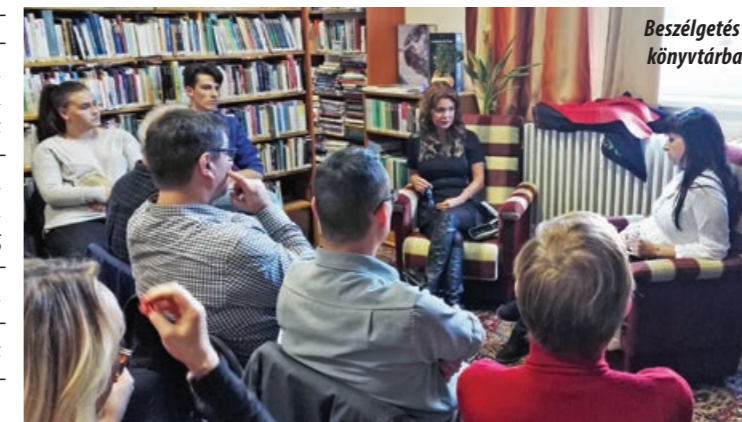
Beszélgetés a könyvtárban

Tóth Krisztina író-költőt, műfordítót, a kortárs irodalom egyik kiemelkedő alkotóját látta vendégül október 4-én a dr. Borzsák István Városi Könyvtár. Több oka is volt annak, hogy az idei Őszi Könyvtári Napok író-olvasó találkozóján a szervezőknek Tóth Krisztinára esett a választása. Tavaly jelent meg az alkotó legutóbbi, Párducpompa című könyve, melyet a monori olvasókörökön már régóta megtalálhat a könyvtárban. Másrészt ebben az évben a hetente megrendezett úgynevezett biblioterápiás foglalkozáson is e kötet novelláival ismerkedhettek meg az érdeklődők.