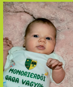
SIMON MINA REBEKA