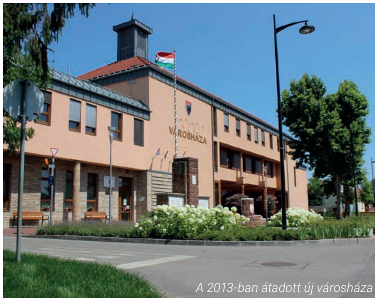
A 2013-ban átadott új városháza

A 2004. év adatahoz képest a lakosságszám növekedése meghaladja a 22%-ot, mára 12 470 állandó lakossal rendelkezünk. Gazdagsági fejlesztési területeink nagysága megötszöröződött, a helyben működő vállalkozások száma pedig sokszorosa a másfél évtizeddel ezelőttinek. Helyi adóbevételünk csaknem ötször magasabb mint 15 éve. Ez a dinamikus fejlődés új kihívást is jelent számunkra, hiszen az itt élő lakosság védelme érdekében a gazdasági