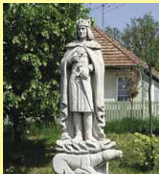
Szent Imre szobor