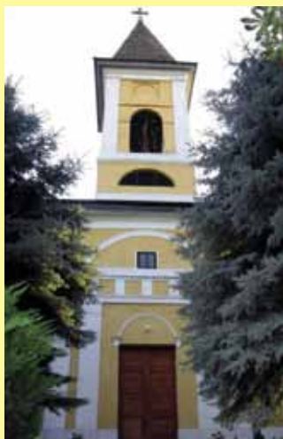
Szent Mihály templom