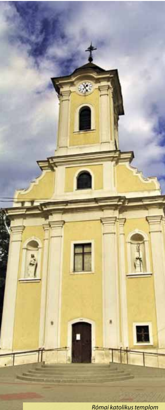
Római katolikus templom