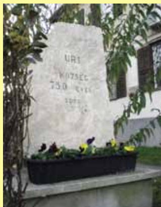
Több mint 750 éves település