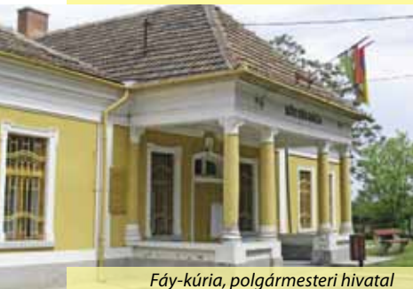
Fáy-kúria, polgármesteri hivatal