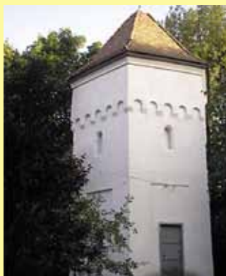
A Szirmay kastély lakótornya