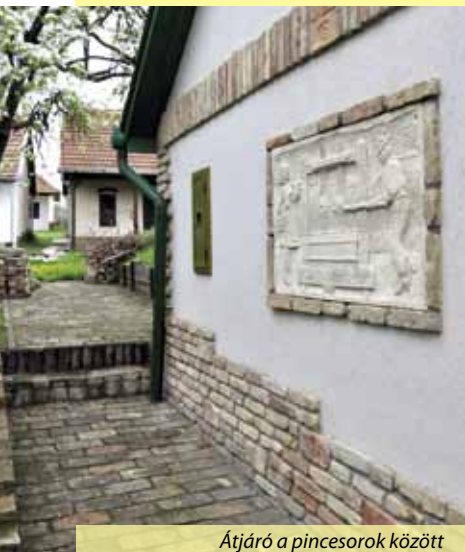
Átjáró a pincesorok között