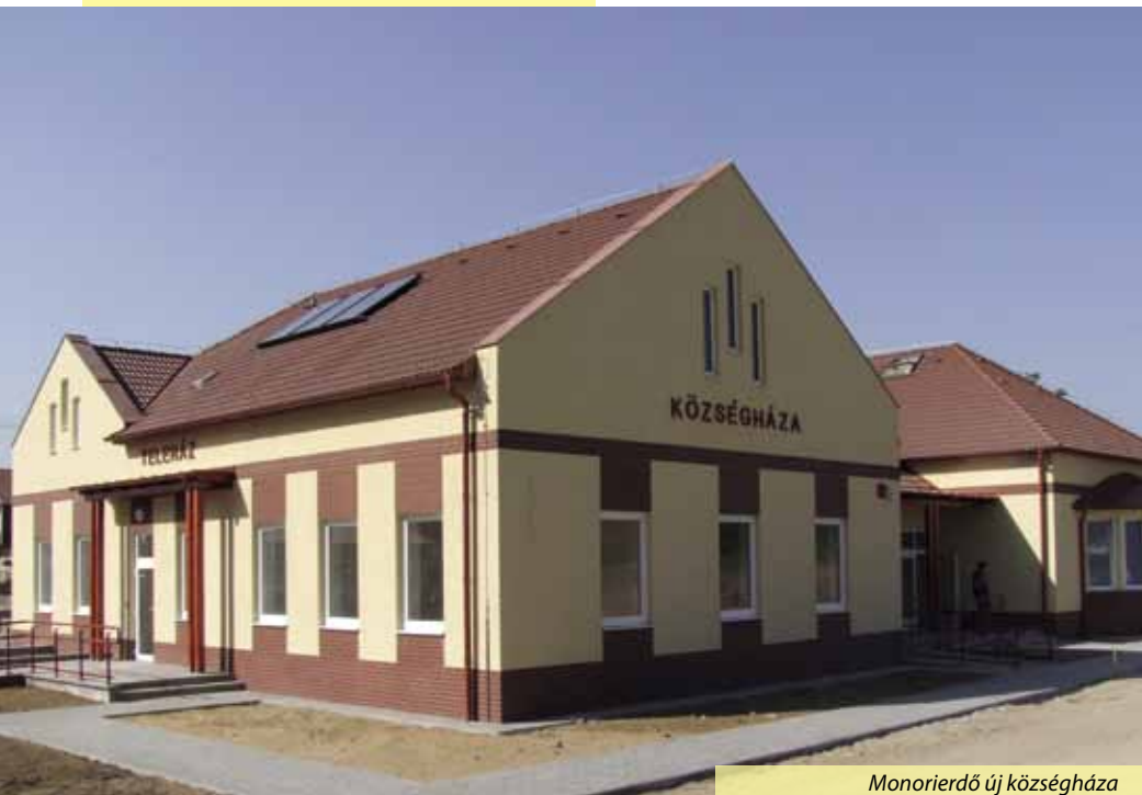
Monorierdő új községháza

A Monorierdőn található kemping történelmi jelentőségű eseménynek is helyet adott: 1985 júniusában itt gyűlt össze mintegy félszáz értelmiségi, hogy megvitassa a közállapotokat. A találkozó óriási jelentőségét az adta, hogy a Kádár-rendszer nyíltan ekkor túrt el először ellenzéki politikai eseményt.