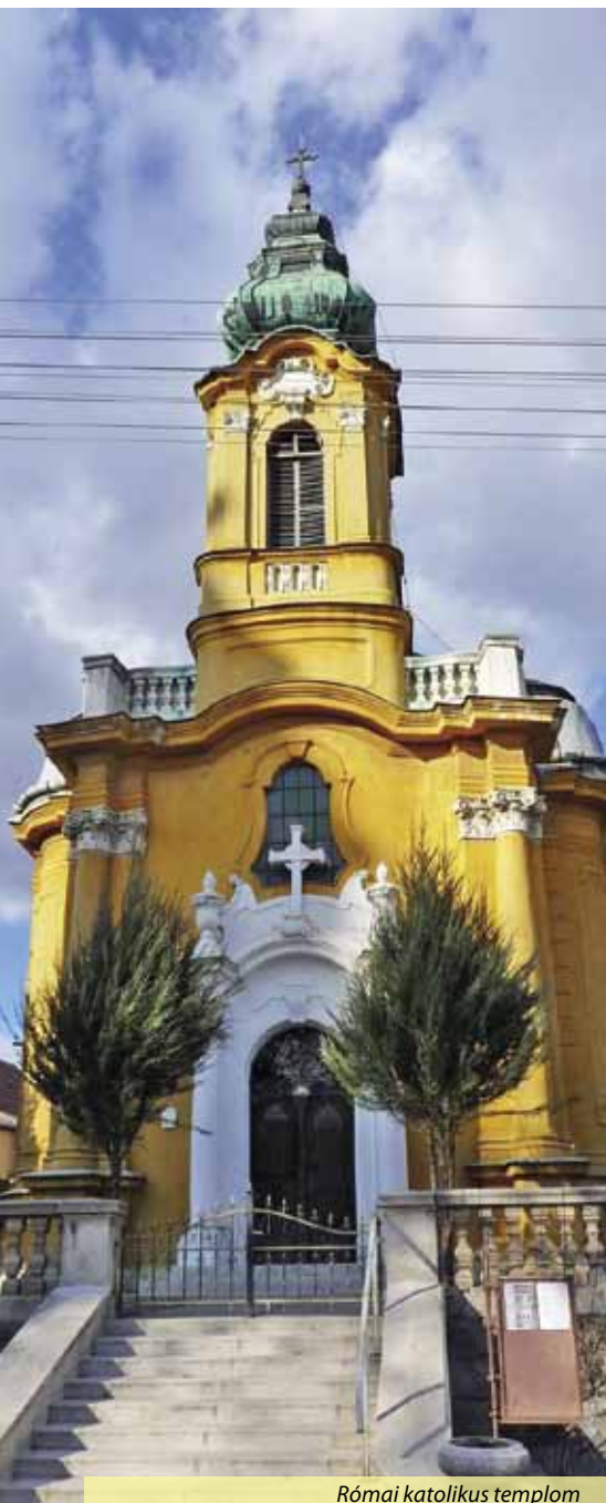
Római katolikus templom