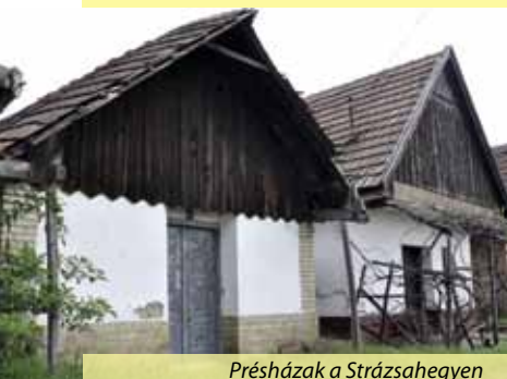
Présházak a Strázsahegyen