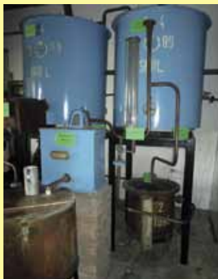
Bényei pálinkafőzde múzeum