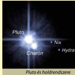
Pluto és holdrendszere

A birtokon található vendégház az elismert, kitűnő szárazhegyi étek és borok felszolgálásával felejthetetlen élményt nyújt a falusi turizmust kedvelők számára.