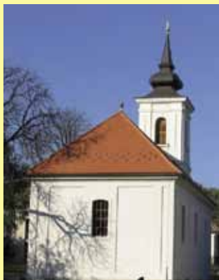
Bényei evangélikus templom

A falu legújabb látnivalója a Leader-program keretében pálinkafőzde múzeummá felújított szeszfőzde.