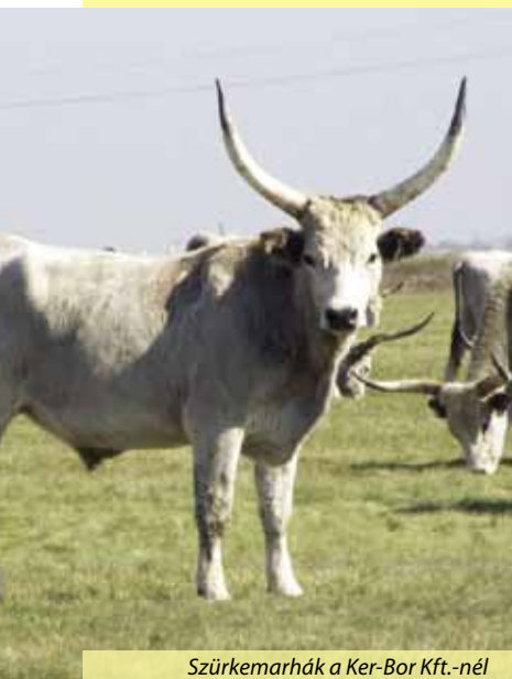
Szürkemarhák a Ker-Bor Kft.-nél