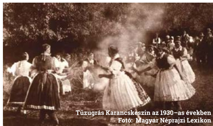
Tűzgrás Karancskészin az 1930-as években