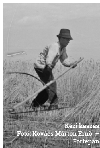
Kézi kaszás

A szertartásos tűzgrásnak egészség- és szerelemvarázsló célzata is volt. A hagyomány szerint, akik Szent Iván éjszakáján átugranak a tűz felett, egész évben együtt maradnak. Szeged környékén a tűzbe dobott almát, torok- és hasfájás megelőzésére