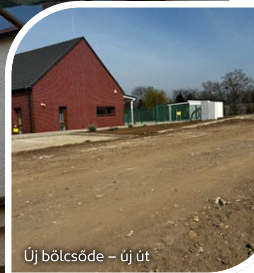
Új bölcsőde – új út