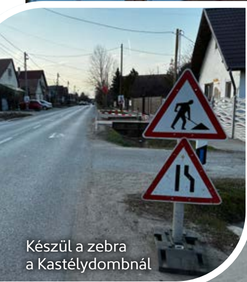
Készül a zebra a Kastélydombnál