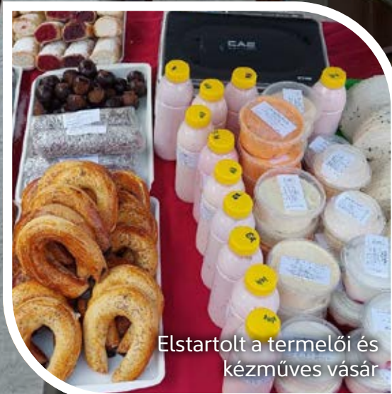
Elstartolt a termelői és kézműves vásár