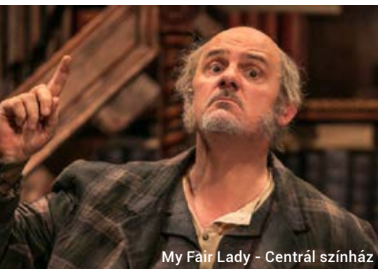
My Fair Lady - Centrál színház

– Szerintem a kapcsolattrendszer, amit hosszú évek alatt építettem fel. Ha felhívok egy művész barátomat, és azt mondom: „Gyere Üllőre, jó lesz!”, nem kérdezi, hogy mi ez, hanem azt, hogy mikor legyen ott. Ez az, ami megfizethetetlen, a bizalom, amely az évek során kialakult és azt eredményezi, hogy első szóra igent mondanak. Remélem, ez még csak a kezdet, és a művészek egymásnak is továbbadják, hogy itt Üllőn hálás és igényes közönség várja őket. Azonban a nagy nevek mellett ugyanilyen fontos, hogy a helyi művészek is lehetőséget kapjanak, hiszen ők azok, akik igazán kötődnek a városhoz, és hosszú távon alakítják a kulturális életet. Célunk, hogy Üllő ne csak befogadója legyen a minőségi előadásoknak, hanem saját kulturális értékeket is teremtsen.