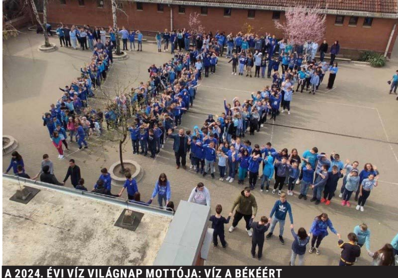
A 2024. ÉVI VÍZ VILÁGNAP MOTTÓJA: VÍZ A BÉKÉÉRT