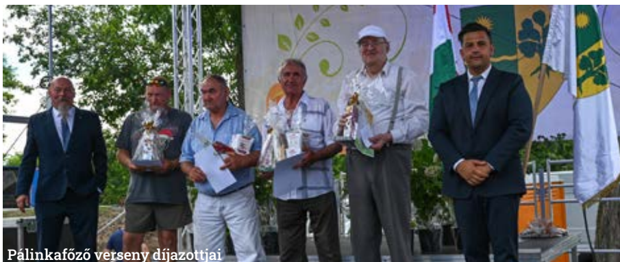
Pálinkafőző verseny díjazottjai

A hagyományos versenyek mindig remek alkalmat teremtenek a versengésre és az együtt ünneplésre. A „Tiszta udvar, rendes ház” verseny arra ösztönzi az embereket, hogy gondoskodjanak környezetükről és otthonuk rendjéről, míg a pálinkafőzés és pogácsasütés igazi gasztró-