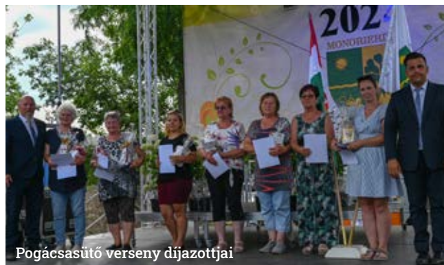
Pogácsasütő verseny díjazottjai