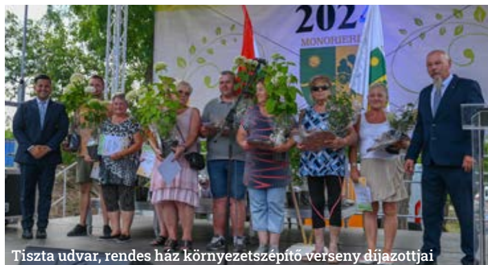
Tiszta udvar, rendes ház környezetszépítő verseny díjazottjai

A szervezők köszönetet mondanak mindenkinek, aki munkájával segített a 2024-es falunap zavartalan lebonyolításában. A lakosoknak köszönik a részvételt és a kedves, dicsérő szavakat.