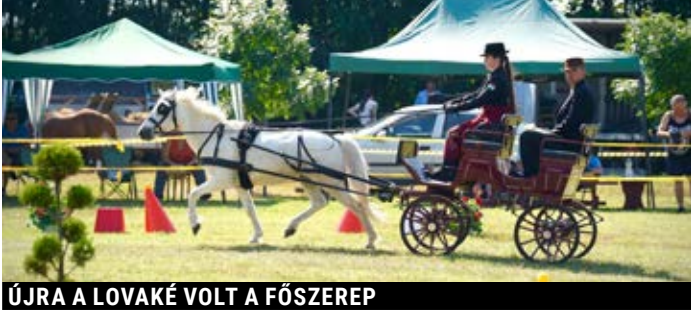
ÚJRA A LOVAKÉ VOLT A FŐSZEREP