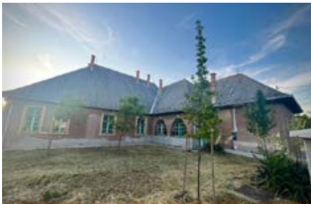
Külön nevelést igénylő sajátos nevelésű gyermekek óvodai gyógypedagógiai nevelését végző intézmény létesül Monoron

Az épületet Monor Város Önkormányzata térítésmentesen biztosítja a Monori Tankerületi Központ részére, ezzel is hozzájárulva a gyermekek helybeli fejlesztésének elősegítéséhez. Az intézmény szeptembertől, várhatóan két csoporttal fog indulni. Bővebb tájékoztatást ezzel kapcsolatban a Monori Tankerületi Központ tud adni.