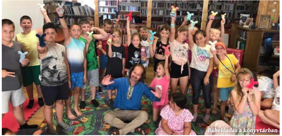
Bábeladás a könyvtárban

az albertirsai állomásra. Ez követően újabb 45 perces vonatra várás következett, végül Monorról négyre értek Csévharasztra. A gyerekek rugalmasan kezelték az utazási tortúrákat, a felnőttek erejét azért kivette a nap.