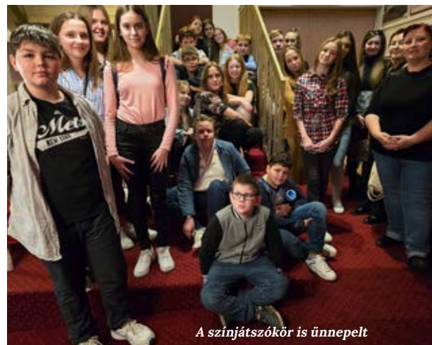
A színjátszókör is ünnepelt

A költemény a zsarnok ellen felszólaló idős és fiatal költők, és az ekkor már – valószínűleg halott – Segesvárnál eltűnt Petőfi hagyatéka előtt tiszteleg. De mit mond a ballada annak, aki manapság olvassa? 2022 óta alkalmat ad az orosz-ukrán háborún való elgondolkodásra, jelesül Ukrajna fegyveres elfoglalására, továbbá Putyin ellenfeleinek elhallgattatására, akiket máglyahál helyett mérgezéssel tüntetnek el. Más kor, kifinomultabb módszerek. Magyarországon is vannak persze furcsa narratívák, és nem mindenki érti a történelem és a jelen kísérteties párhuzamait. Ezért is volt annyira kifejező és továbbgondolásra