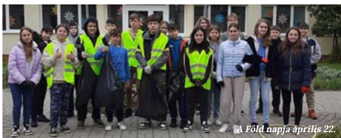
A Föld napja április 22.