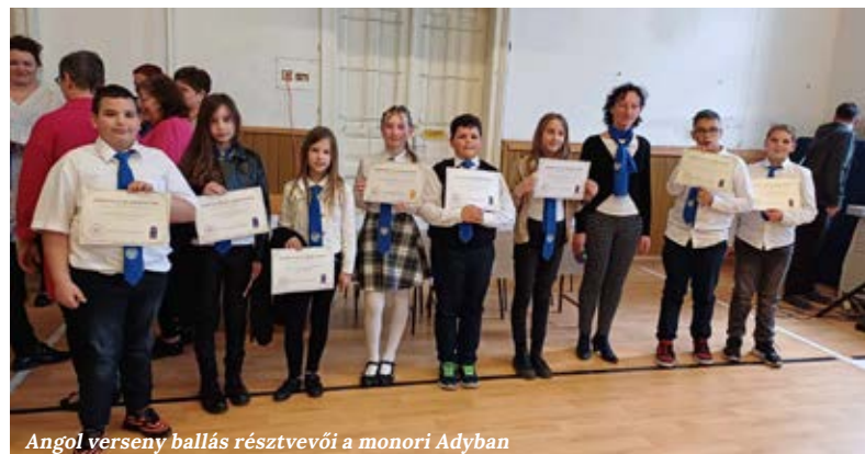
Angol verseny ballás résztvevői a monori Adyban