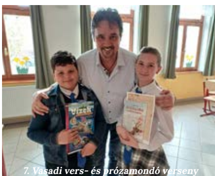
7. Vasadi vers- és prózamondó verseny