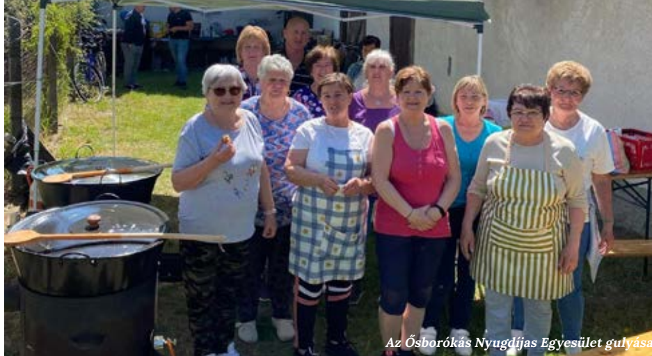
Az Ósborókás Nyugdíjas Egyesület gulyása

A gyerekek déltől este 6-ig többszörösen kiugrálhatták magukat, nemcsak a díj-