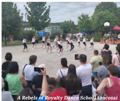
A Rebels of Royalty Dance School táncosai

A 15 óraker érkezett a Csévharaszi Népdalkör dal- és verscsokorral, amit citerakísérett élénkített, őket követte a közel 70 fős hip-hop táncos. A koreográfiákhoz illő szettekbe öltözött dinamikus mozgású gyerekek, sokszínű csoportos koreográfiákat adtak elő. A gyömrői székhelyű Rebels of Royalty Dance School méltán közkedvelt tánciskola a környéken, hiszen a kisiskolásoktól a gimnazista korosztályig színvonalas produkciókat tud felmutatni. A Balla