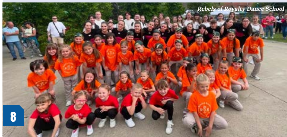
Rebels of Royalty Dance School

Az edzők Csévharaszt, Monor, Üllő, Gyömrő, Mende, Nagykáta településeinek tartanak órákat az óvodástól egészen a felnőtt korosztályig a tudásszintnek megfelelően.