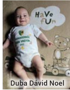
Duba Dávid Noel