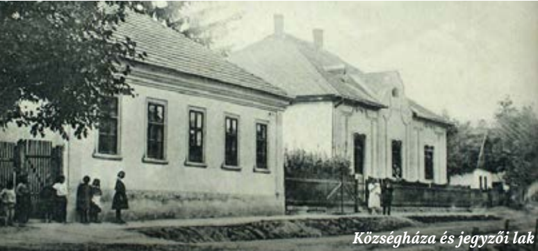
Községháza és jegyzői lak