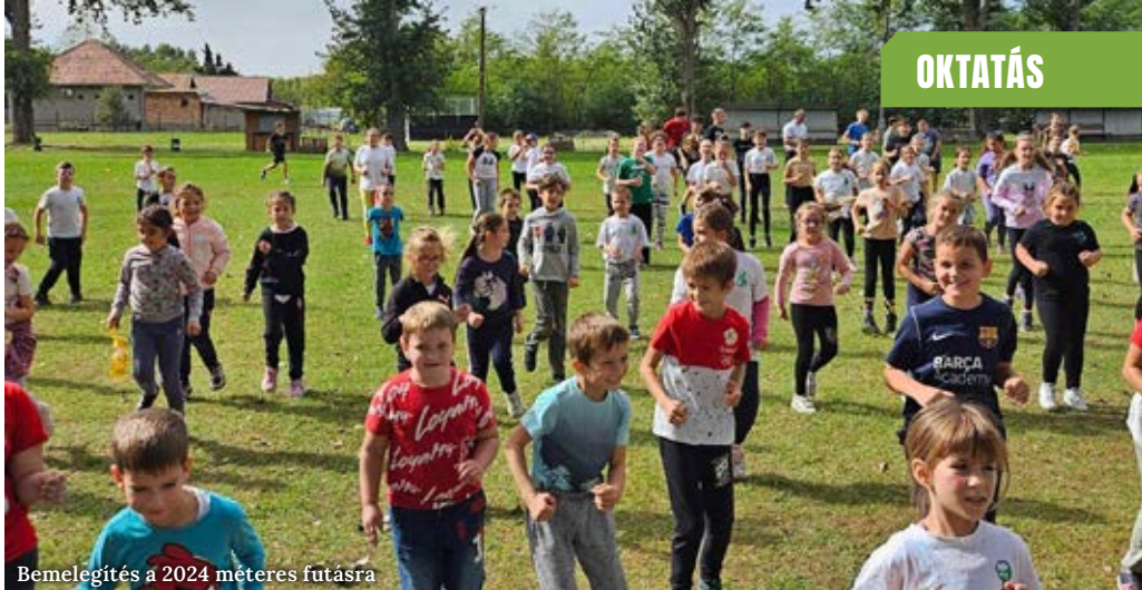
Bemelegítés a 2024 méteres futásra

A ballás diákokok már a hét elején csapatokba tömörültek, nevet választottak, menetlevelet és zászlót készítettek, indulót írtak, amiért pontokat kaptak a kreativitásuk függvényében. A diákönkormányzati napon a nagycsoportosok is csatlakoztak az alsó-