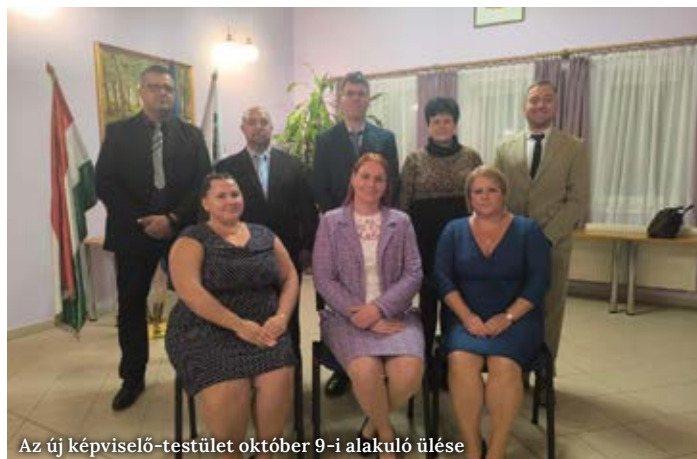
Az új képviselő-testület október 9-i alakuló ülése

„Becsületemre és lelkiismeretemre fogadom, hogy Magyarországhoz és annak Alaptörvényéhez hű leszek; jogszabályait megtartom és másokkal is megtartatom; a képviselői/polgármesteri/alpolgármesteri/bizottsági tagi tisztségemből eredő feladataimat Csévharaszt fejlődésének előmozdítása érde-