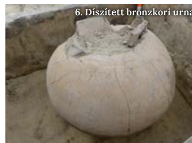
6. Díszített bronzkori urna