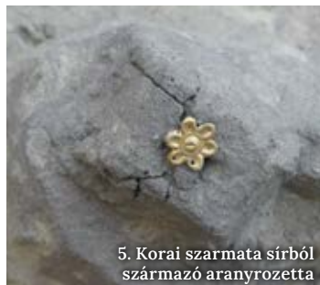
5. Korai szarmata sírből származó aranyozetta