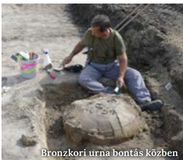
Bronzkori urna bontás közben