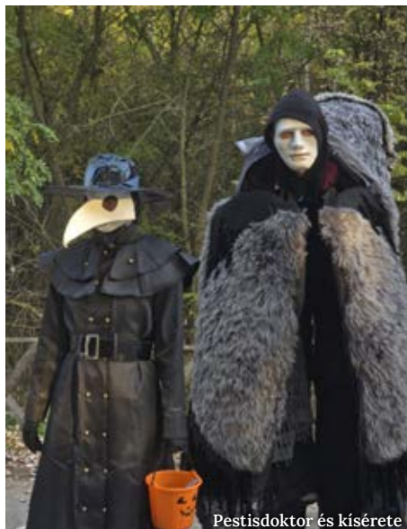
Pestisdoktor és kísérete