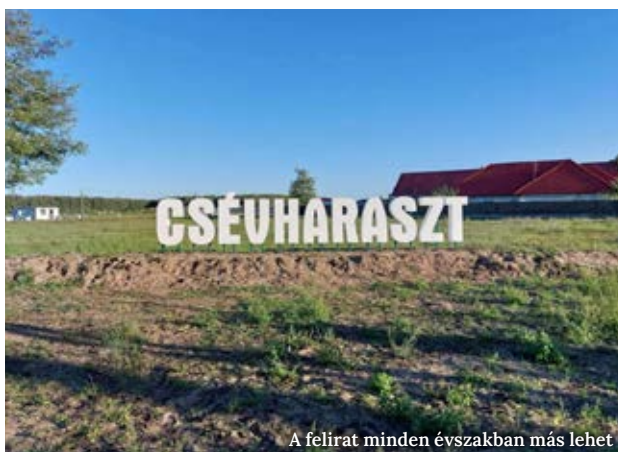
A felirat minden évszakban más lehet