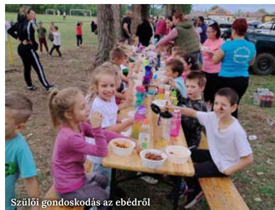
Szülői gondoskodás az ebédről