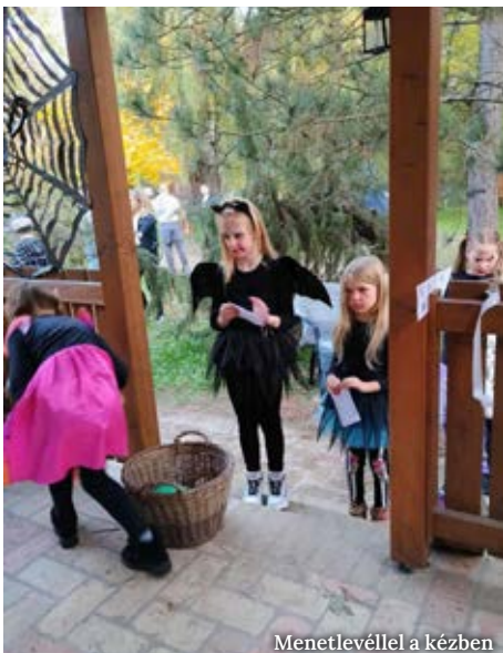
Menetlevéllel a kézben

A labirintus előtt várakozók csodálkozva hallgatták a „halálsikolyokat”. Azok, akik először jártak itt, nem tudták elképzelni, hogy mi történik majd, amikor rálépnek a Pótharaszti Sétaerdő Kis sétakoréire. Például az, hogy a sötétből kilépve megfogja