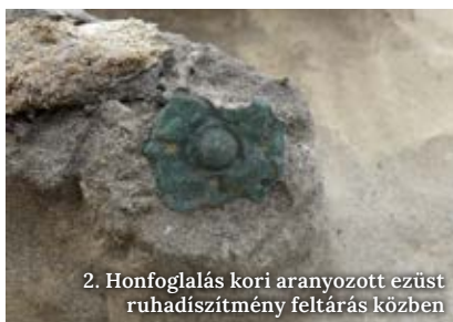
2. Honfoglalás kori aranyozott ezüst ruhadíszítmény feltérás közben