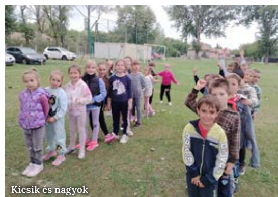
Kicsik és nagyok