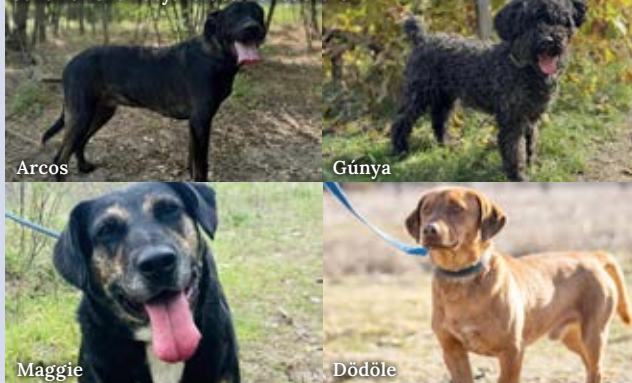
Gazdira váró kutyák