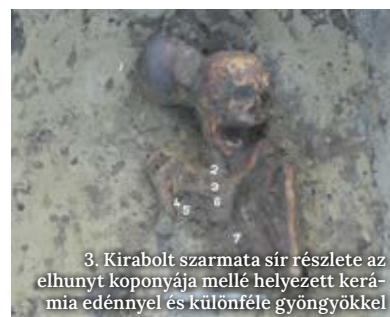
3. Kirabolt szarmata sír részlete az elhunyt koponyája mellé helyezett kerámia edénnyel és különféle gyöngyökkel

A honfoglalás kori és szarmata temetkezések mellett nagyobb számban kerültek elő bronzkori urnasírok, amelyek a Vátya-kultúrához köthetőek. A díszített és olykor tállal lefedett urnák egy része kiváló állapotban maradt fent és egyben kiemelhető volt (6. kép). Ezekről a helyszínen háromdimenziós dokumentációt is készítettünk, majd restaurátor műhelybe szállítottuk, ahol további bontásuk jelenleg is folyamatban van. Szintén bronzkori, de csak további elemzéssel pontosabban korszakolható az a temetkezés is, amelyet bár kiraboltak, de az elhunyt lábánál a sírgödör alján szerencsésen megmaradt egy kerámia-