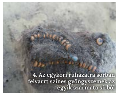
4. Az egykori ruházatra sorban felvarrt színes gyöngyszemek az egyik szarmata sírből