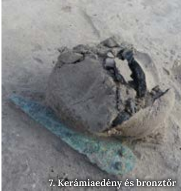
7. Kerámiaedény és bronztör