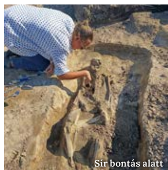
Sír bontás alatt