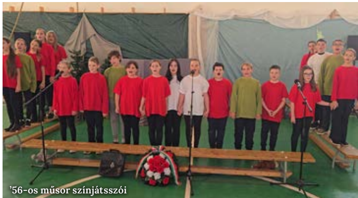
'56-os műsor színjátsszói