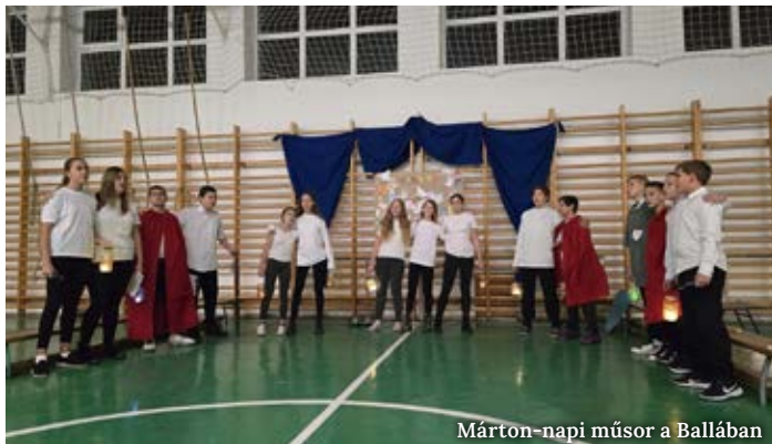
Márton-napi műsor a Ballában