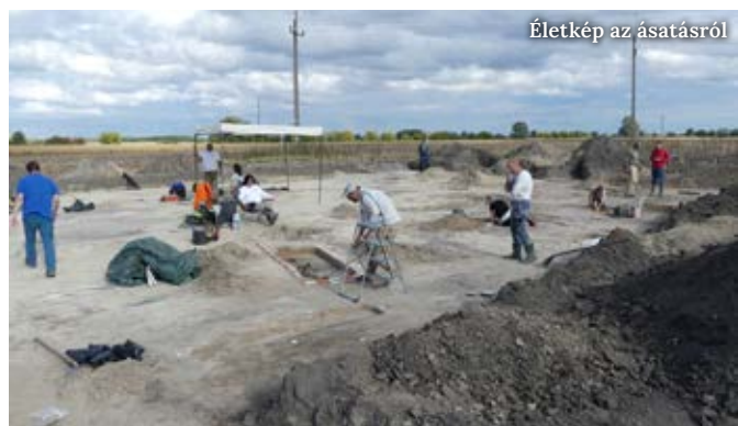
Életkép az ásatásról

A szöveg szerzője: Giedl Dániel régész-muzeológus, Ferenczy Múzeumi Centrum