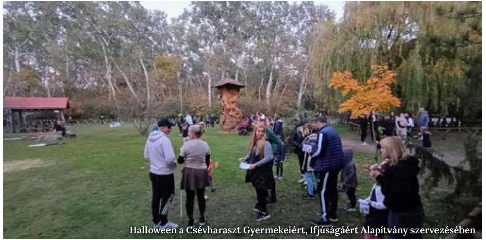
Halloween a Csévharaszt Gyermekéiért, Ifjúságáért Alapítvány szervezésében

Mindezek sikeres teljesítése után a gyerekek megkapták a kemény munkájukért járó jutalmat. De ha még ez sem lett volna elég, akkor további kihívások várták őket: akadálypálya, óriáscsúzli és célba gurítás. Az erdőéri lagnál lévő kilátó és a játszótér is a rendelkezésükre állt.