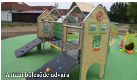
A mini bölcsőde udvara

légkör várja a Tipegő és a Cseperedő csoport „lakóit”, akik tiszta, biztonságos, szeretetteljes és fejlesztő környezetben lehetnek.”