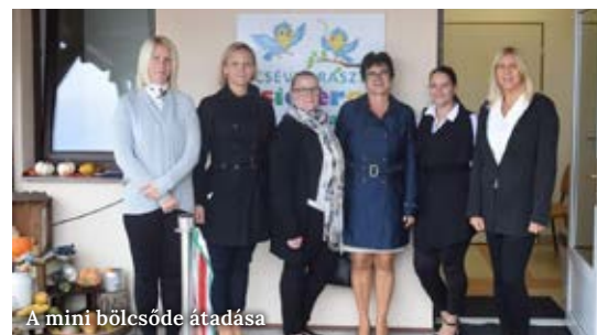
A mini bölcsőde átadása

Nem sokkal a megnyitót követően a Csévharaszti Csicsergő Mini Bölcsőde október 21-én, hétfőn megnyitotta kapuit. Az igazgatót idézve: „A gondozók nagy örömmel és izgatottan fogadták a kicsiket, akik szüleikkel közösen töltötték el első napjukat az intézményben. A bölcsődében modern, családias