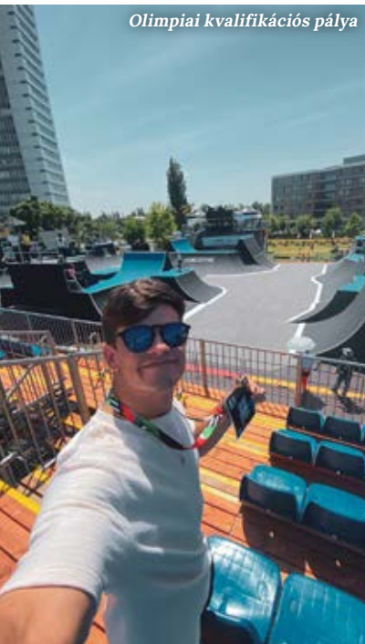
Olimpiai kvalifikációs pálya