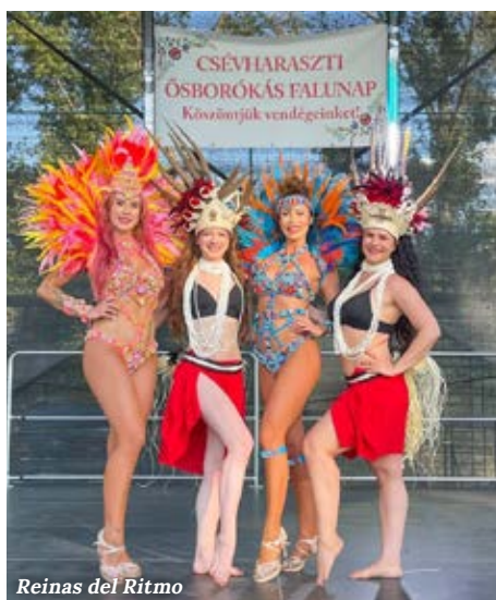
Reinas del Ritmo