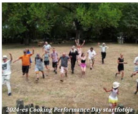
2024-es Cooking Performance Day startfotója

Amikor mindenki odaér, a Cooking Performance Day egy futással veszi kezdetét, akkor készül a startfotó.