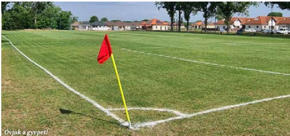
Óvjuk a gyepet!

A rolleresek is preferálják a pályát, főként öntözés után, amikor azon farolgatnak. Ez a jelenség eléggé bosszantja a KSK-t, ezért az