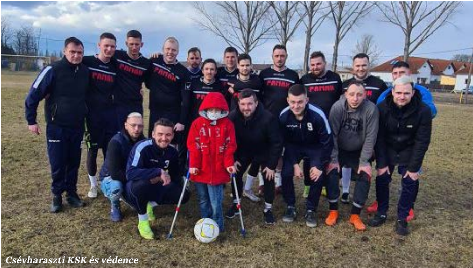
Csévharaszi KSK és védence