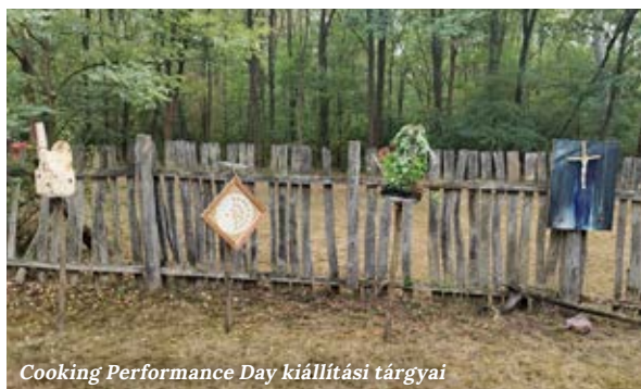
Cooking Performance Day kiállítási tárgyai

A Cooking Performance Day mindig az alkotásról, a kreativitásról, kicsit külön emberek kapcsolódásáról szól. A napsugarakat követő esős erdőben Kanczler Klára festménye jelent meg elsőként a Róth-háznál, melyhez keskeny, erdei út vezet; nem nagyon lehet kitérni se jobbra, se balra, ha szembe jön valaki, néha tolatni kell, de a vasadiaknak ez nem okoz gondot.