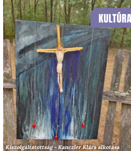
Kiszolgáltatottság - Kanczler Klára alkotása

Elveszett paradicsom vagy a paradicsom ígérete? Mindkettőt összeköti a szenvedéstörténet. Az ember kiüzetett a paradicsomból, a bűn annyira a részünk, mint a ránk ható