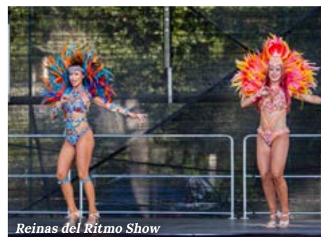
Reinas del Ritmo Show

jókedvéről és pompás viseleteiről híres. Autentikus ruháikat idén is megcsodálhattuk, miközben pörögtek a lányok, majd mindannyian összeálltak egy közös fotó készítéséhez. A 2024-es falunapon a karneváli hangulat is felütötte a fejét, hiszen