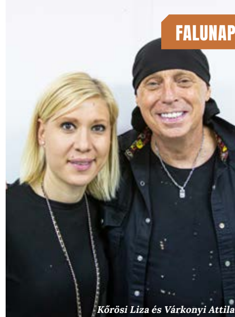
Kőrösi Liza és Várkonyi Attila

A 2024-es XVII. falunapon több mint 15 perccel tovább maradt, ez ritkaságszámba megy, hiszen az ideje mindig nagyon ki van számolva, Magyarországon még mindig ő a legnépszerűbb és legaktívabb dj. „Nyáron általában csütörtöktől vasárnapig le vannak kötve a fellépések. Próbálnak minden felkérésnek eleget tenni, de azért a távolság is szerepet játszik a programtervezésben. Az útvonalat úgy állítják össze, hogy 3-4 fel-