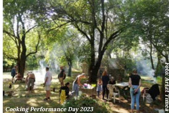
Cooking Performance Day 2023