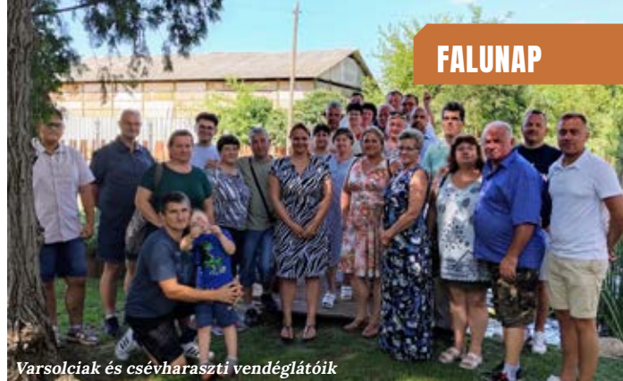
Varsolciak és csévharaszi vendéglátóik

Vasárnap egy közös ebéd élményével indították útjuk a varsolciakat, akikkel kellemes, aktív időt töltöttek el a vendéglátóik. Lapunk tudósítója a Tanya Csárdában érte őket „tetten”, így készült egy közös fotó a 2024-es nyári találkozó emlékére. Szerk.