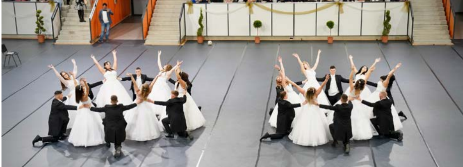
KÁPRÁZTOS ESEMÉNY VOLT