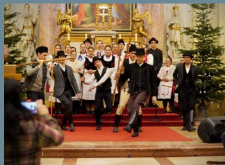
Így telt az ADVENTI IDŐSZAK