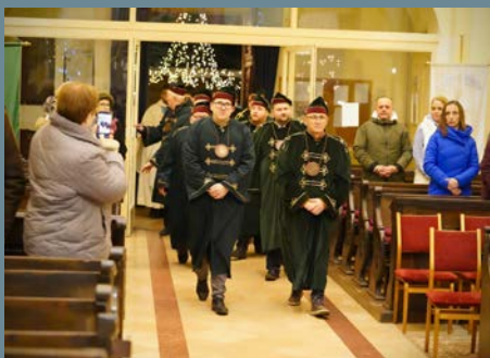
JÁNOS-NAPI boráldás Monoron