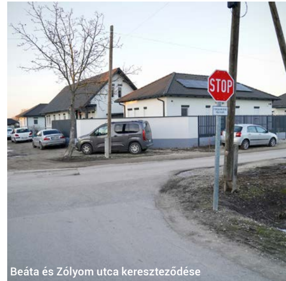
Beáta és Zólyom utca kereszteződése

utcából érkezőknek is meg kell állniuk a kereszteződésbe való behajtás előtt. A tábla körüli figyelemfelhívó jelzés is segíti a forgalmi rend változásának észlelését.