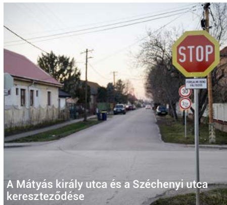
A Mátyás király utca és a Széchenyi utca kereszteződése

Január közepén Darázsi Kálmán polgármester adta hírül közösségi oldalán a legújabb forgalmirend-változásokat. Ezek alapján a Beáta és a Zólyom utca kereszteződéséhez stoptábla került kihelyezésre, így a Zólyom utcából érkezőknek a kereszteződésbe való behajtás előtt az elsőbbségadás mellett meg is kell állniuk. A Mátyás Király utca és a Széchenyi utca kereszteződéséhez szintén stoptábla került kihelyezésre, így a Széchenyi