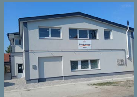
EGY ESÉLY AZ újrakezdésre