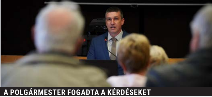
A POLGÁRMESTER FOGADTA A KÉRDÉSEKET