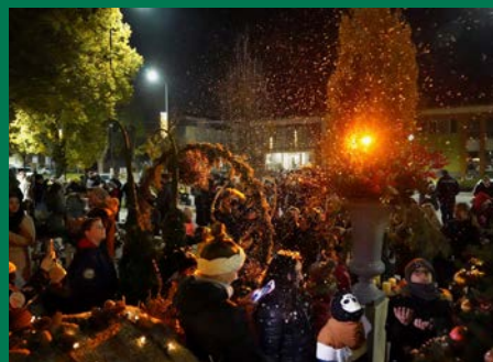
XVI. szabadtéri ADVENTI KIÁLLÍTÁS