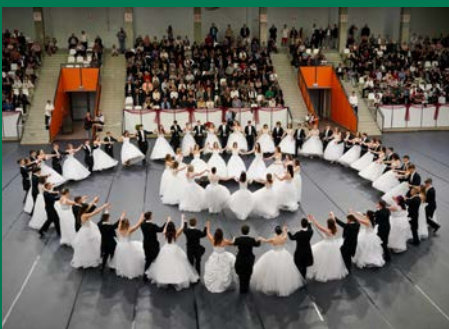
SZALAGAVATÓ – 163 diáknak tűztek szalagot