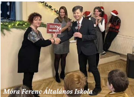
Móra Ferenc Általános Iskola

A programba bárki regisztrálhat, aki szeretné a diákok esélyeit növelni az egyes iskolák keretein belül – legyen az pedagógus, barát, szülő vagy akár nagyszülő. Elég csak letölteni a programhoz tartozó „Millió lépés az iskoláért” applikációt, regisztrálni az adott iskola neve alatt, és minden nap rögzíteni az adott elvégzett sporthoz tartozó mozgásidőt vagy lépésszámot.