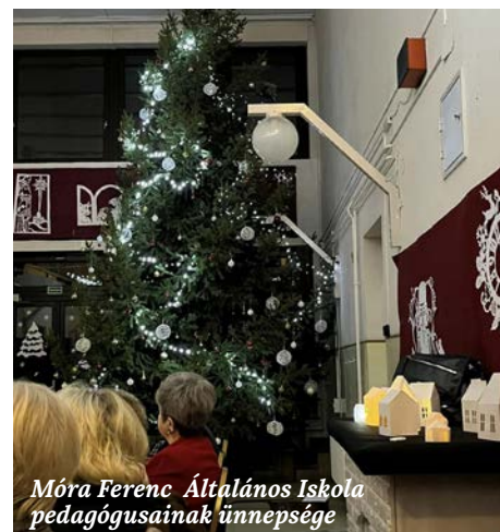
Móra Ferenc Általános Iskola pedagógusainak ünnepe