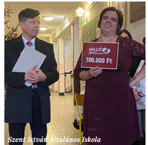
Szent István Általános Iskola