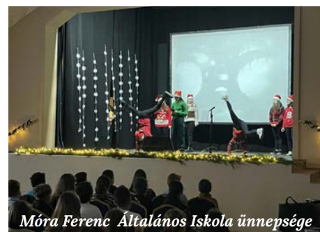
Móra Ferenc Általános Iskola ünnepe

A szünet előtti napokban a város vezetője együtt hangolódott a süllyápi általános iskolák által szervezett ünnepeken a gyerekekkel, de ellátogatott a pedagógusok számára szervezett vacsorára is, ahogyan az óvoda dolgozóit is köszöntötte.