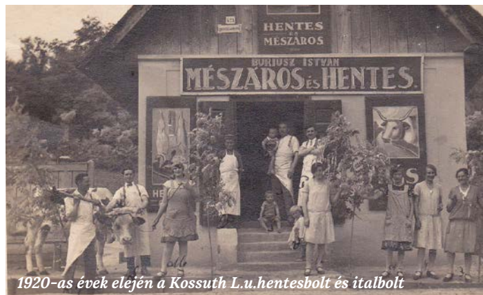
1920-as évek elején a Kossuth L.u.hentesbolt és italbolt