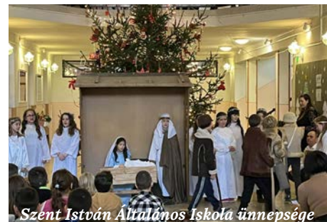
Szent István Általános Iskola ünnepe