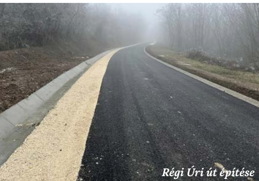
Régi Úri út építése

Mivel a kivitelező, a Németh Út Kft. készre jelentette a munkát, ezért december 18-ával megkezdődött a Régi Úri úttal kapcsolatos műszaki át-