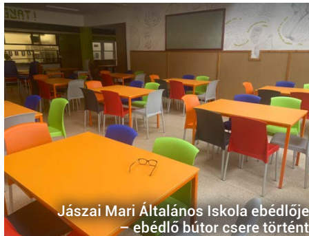
Jászai Mari Általános Iskola ebédlője – ebédlő bútor cseréje történt

A Nemzetőr és az Ady Úti Általános Iskolákban található tálalókonyhákhoz tartozó étkezőhelyiségekben a linóleum oly mértékben elhasználódott, hogy azok a felkopások miatt balesetveszélyessé váltak, emellett a tálalókonyhák étkezőinek bútorait tekintve is megkeresés érkezett a Nemzetőr Általános Iskolától, ráadásul a bútorokra hatósági kifogást is kaptak. A Jászai Mari Általános Iskolában szintén rossz állapotban voltak a bútorok, így szükséges volt a csere.