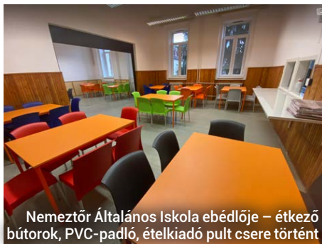
Nemzetőr Általános Iskola ebédlője – étkező bútorok, PVC-padló, ételkiadó pult cseréje történt

M onor városvezetése korábban testületi határozatban döntött az iskolákat érintő beruházásokról. Nyár végére meg is történt az új étkezőasztalok és székek beszerzése, valamint a PVC-padlóburkolat is kicserélésre került az intézmények ebédlőiben. A korábbi állapotokhoz képest mintha egy egészen új környezettel várnák a diákokat: a szép új padlóburkolat mellett a tanulók mostantól vidám, színes ebédlőbútorokon fogyaszthatják el az ebédet. A városvezetés bízik benne, hogy a diákok is ugyanúgy fognak örülni az új környezetnek, ahogy az iskolavezetés.