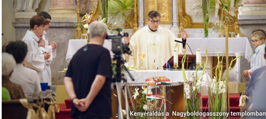
Kenyérválasztás a Nagyboldogasszony templomban