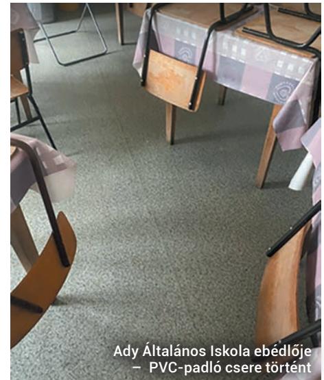
Ady Általános Iskola ebédlője – PVC-padló cseréje történt

Az Ady Általános Iskola ebédlőjében PVC-padló cseréje történt, a Jászai Mari Általános Iskola ebédlőjében az ebédlő-