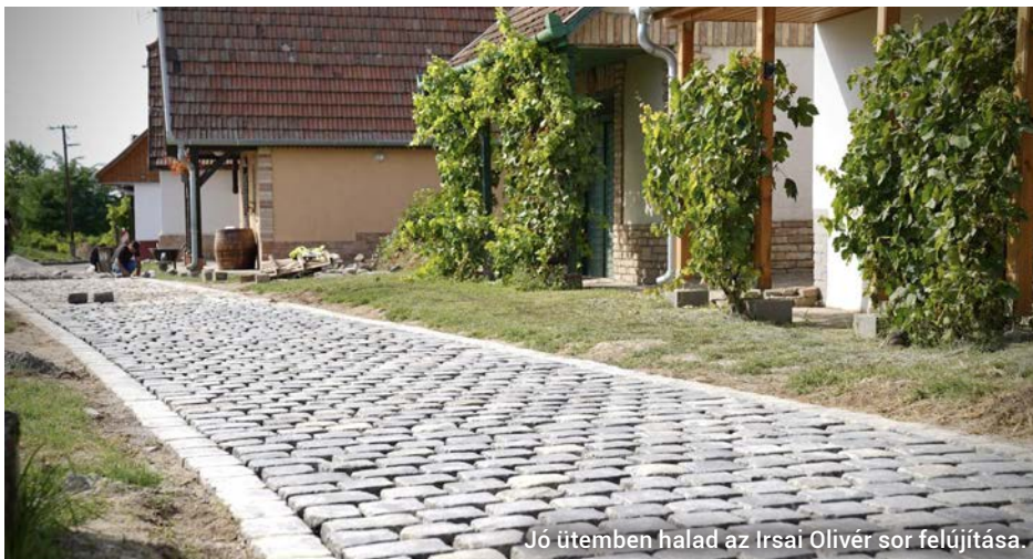
Jó ütemben halad az Irsai Olivér sor felújítása.

Most írjuk alá a szerződést, megtörtént a kivitelező kiválasztása, nagyon sok járdaszakasz fog megújulni a városban. A kiválasztásnál fontos szempont volt, hogy egyszerre nagyobb összefüggő szakaszokat építsünk meg, melyek gyalogosok által gyakran használt területek legyenek. Így például nagyon fontos rész lesz a szakrendelőnél épülő járda, a Balassi Bálint utca felőli részen, a kiemelt szegélyek is a helyükre kerülnek, így pedig a