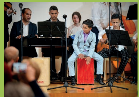
A MÁLTAI SZIMFÓNIA koncerttel segített