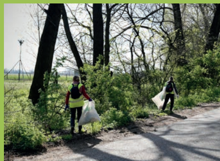
Idén is sikeres volt a TE SZEDD! MOZGALOM