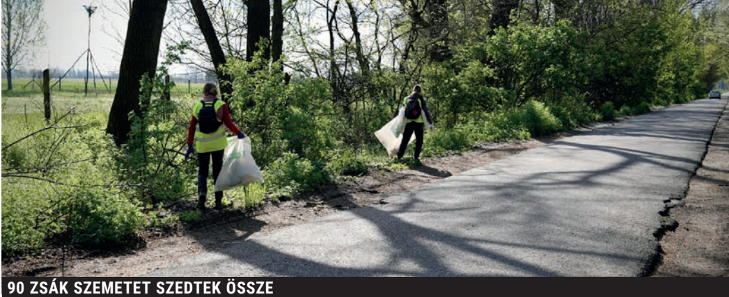
90 ZSÁK SZEMETET SZEDTEK ÖSSZE