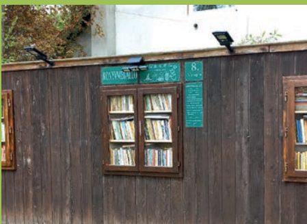
KÖNYVMEGÁLLÓ VÁRJA az olvasni szeretőket