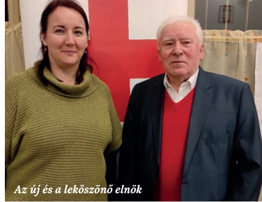
Az új és a leköszönő elnök

Örülök, hogy 55 évi munka után valódi nyugdíjas leszek, de nem otthonülő, hanem lehetőségemhez mérten életem végéig vöröskeresztes akarok maradni!