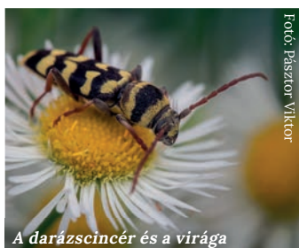
A darázscincér és a virága