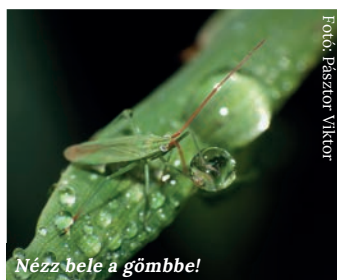
Nézz bele a gömbbe!