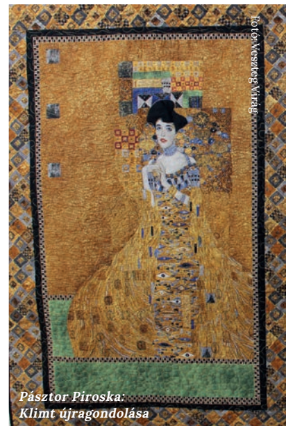
Pásztor Piroška: Klimt újragondolása