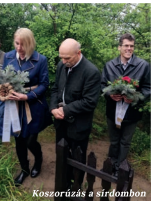
Koszorúzás a sírdombon