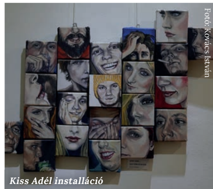
Kiss Adél installáció