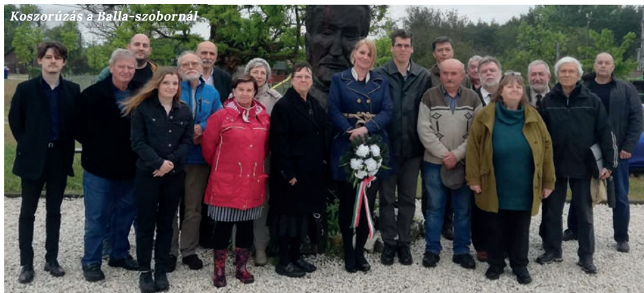
Koszorúzás a Balla-szobornál