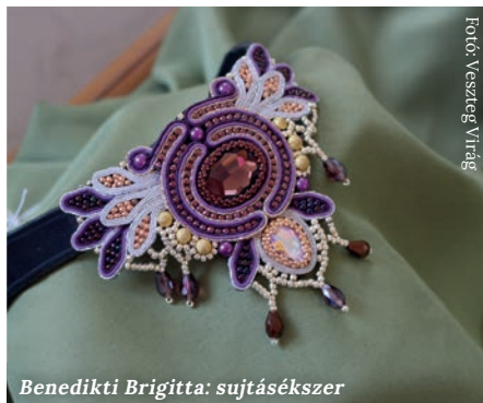
Benedikti Brigitta: sujtásékszer