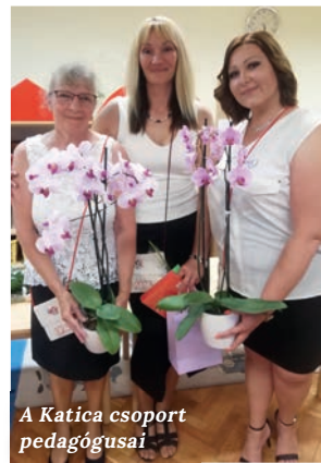
A Katica csoport pedagógusai

Csévharaszton több kisgyermekes szülő sérelmezi azt, hogy a két és fél éveseket nem veszik fel, holott korábban ezzel ellentétes volt a gyakorlat. Igen, voltak olyan idők, amikor 16 fős csoportokkal ment az óvoda, de azóta a csoportlétszámok szinte a duplájára nőttek.