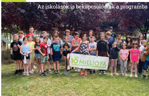
Az iskolások is bekapcsolódtak a programba

– Rövid távú célunk, hogy Monorierdő Község Önkormányzatával együttműködve, önkéntesek bevonásával már idén ősszel több ezer fát elültethessünk. Hosszú távú célunk pedig az 1 fő – 1 fa elv alapján, hogy Monorierdő területén legalább annyi fát ültessünk el, ahány lakosa településünknek van.