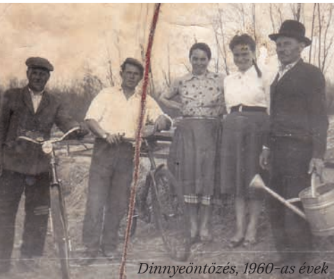
Dinnyeöntözés, 1960-as évek