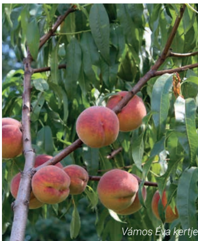
Vámos Éva kertje