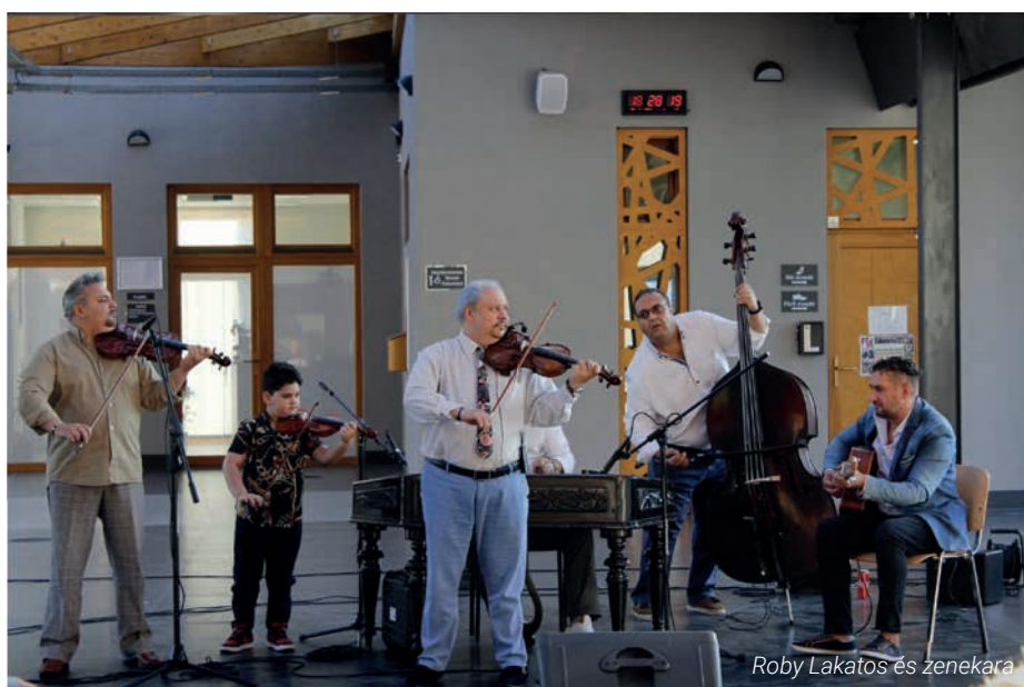
Roby Lakatos és zenekara